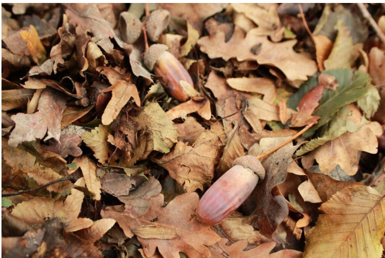
Semi di farnia

Ora conosciamo decine di piante da cui, già dalla prossima stagione, potremo raccogliere semi con caratteristiche genetiche che potrebbero rivelarsi importanti per la resistenza al deperimento.