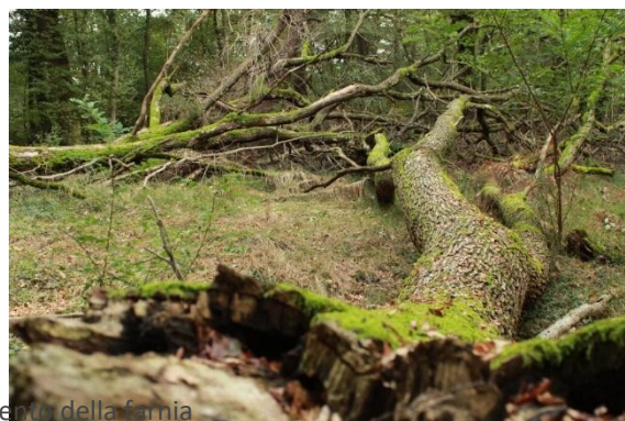
Segnali di deperimento della farnia

Il progetto ResQ ha indagato le cause del deperimento della farnia, specie emblematica dei boschi di pianura che caratterizza gli ecosistemi forestali del bacino padano-veneto, per cercare di trovare soluzioni efficaci per arginarlo.